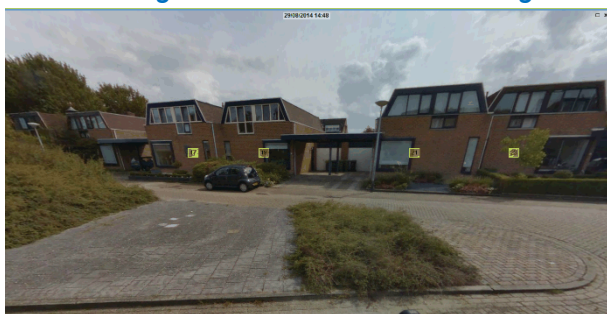
Offenbachlaan situatie 2014

Dit is al beleid van de gemeente. Op de locatie van basisschool Het Vlot is bijvoorbeeld een waterbergingsparkje aangelegd. Ook op straatniveau worden overgedimensioneerde bestratingsvlakken omgezet naar groen.